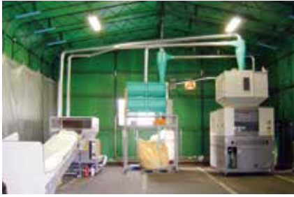
遠赤外線方式発泡スチロール減容機

このシステムは排出された発泡スチロールを安全に再資源化し、それに関わる製品開発を目指すことにより地域社会に貢献することを目的としています。