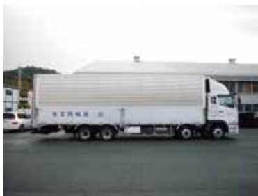
■ 10t超 ウイング車