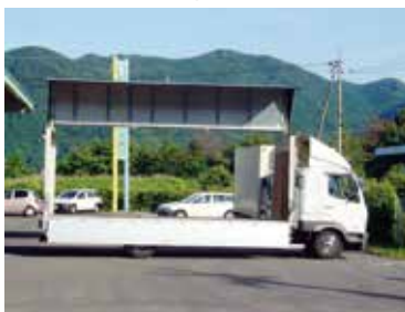
■ 4t ウイング車